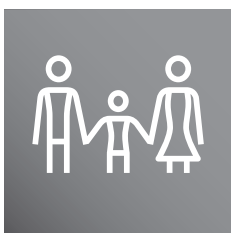
Tabela invalidnosti za določanje trajne izgube splošne delovne sposobnosti zaradi nezgode

Skladno s 25. členom splošnih pogojev za nezgodno zavarovanje je Tabela invalidnosti za določanje trajne izgube splošne delovne sposobnosti zaradi nezgode (v nadaljnjem tekstu: tabela) sestavni del splošnih pogojev in vsake posamezne pogodbe o nezgodnem zavarovanju.