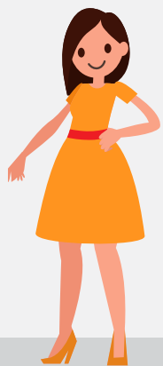
Maja, 25 let

Pomembno je, da ste ustrezno zavarovani. Oglejte si različne primere zavarovanih oseb in informativne izračune.